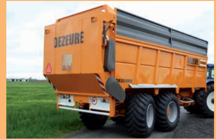
Grotere stuurhoek met fusee gedwongen stuuras Tourner plus court avec essieu directionnel